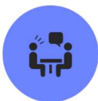
情報セキュリティ アドバイザー