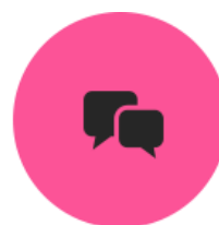
情報セキュリティ あれこれ Web Q&A