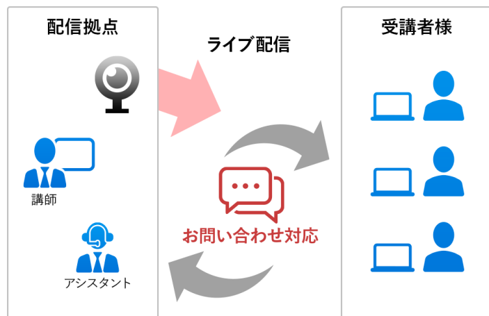
ご提供イメージ図